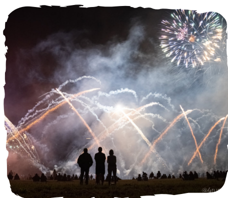
UN SHOW PYROTECHNIQUE SPECTACULAIRE