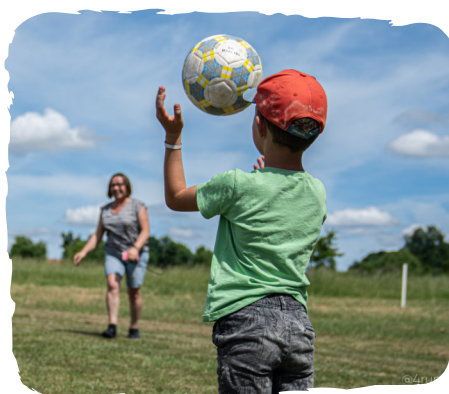
DÉCOUVERTES ET INITIATIONS TOUT LE WEEK-END