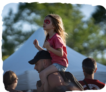
WEEKÉLÉLÉ : DES CONCERTS DE UKULÉLÉ