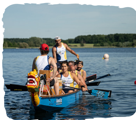
UNE COMPÉTITION NATIONALE DE DRAGONBOAT