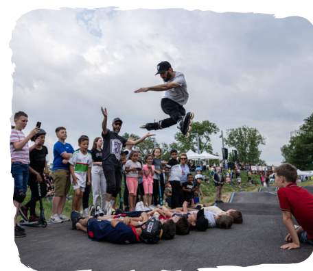
DES SESSIONS SPORTS EXTRÊMES À SAINT-DIZIER